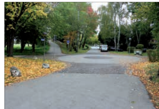
1 Gefahrenstelle Edelweißstraße / Distelweg Gefahr beim Überqueren der Straße durch Autos aus drei Richtungen.